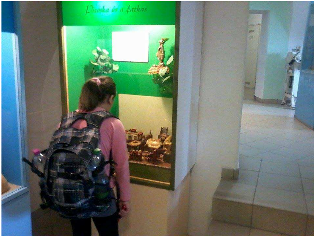
...s a 3D képek.