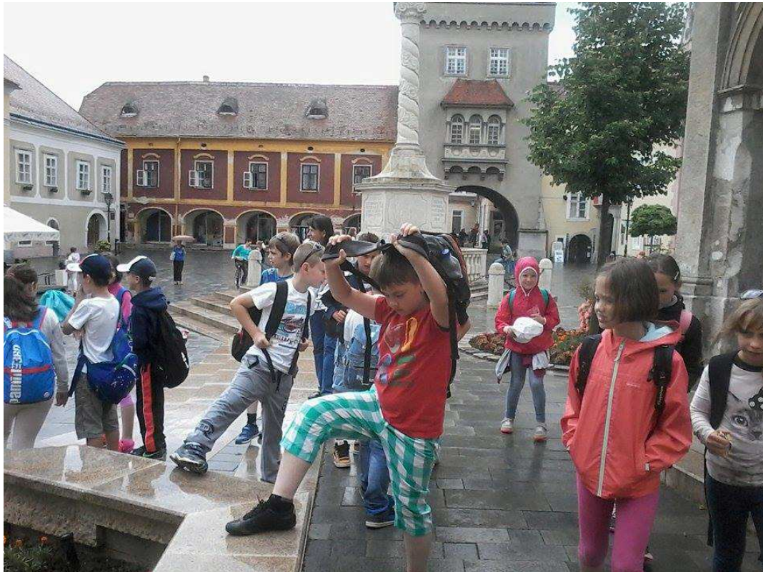
...még egy kis rögtönzött próbára is futotta.